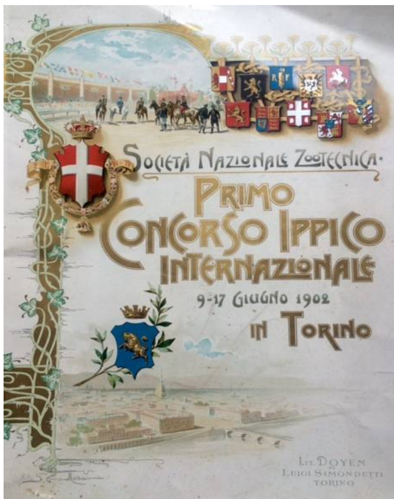
n° 44 - PRIMO CONCORSO IPPICO INTERNAZIONALE 9-17 giugno 1902 in TORINO