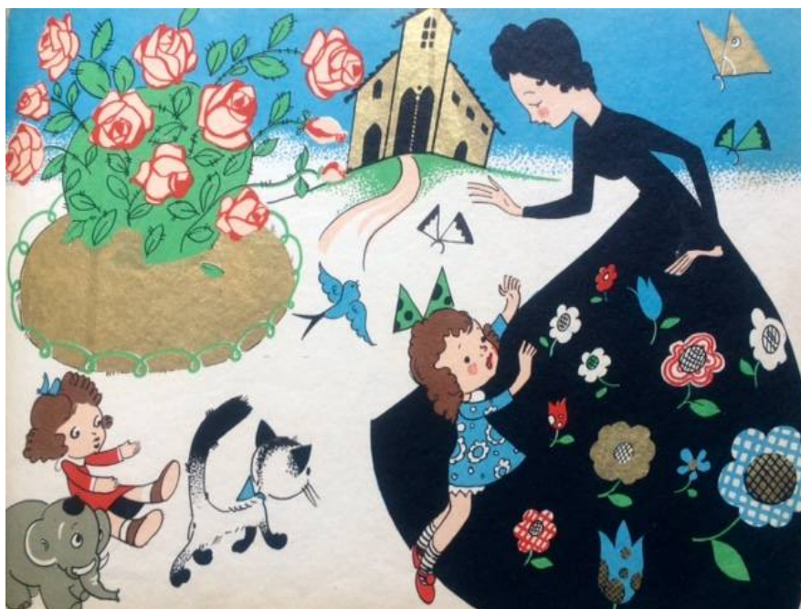
n° 112 – Fiaschetti. Ti narro ogni cosa